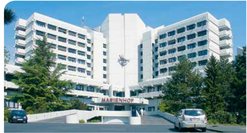
Marienhof Koblenz (MHK)