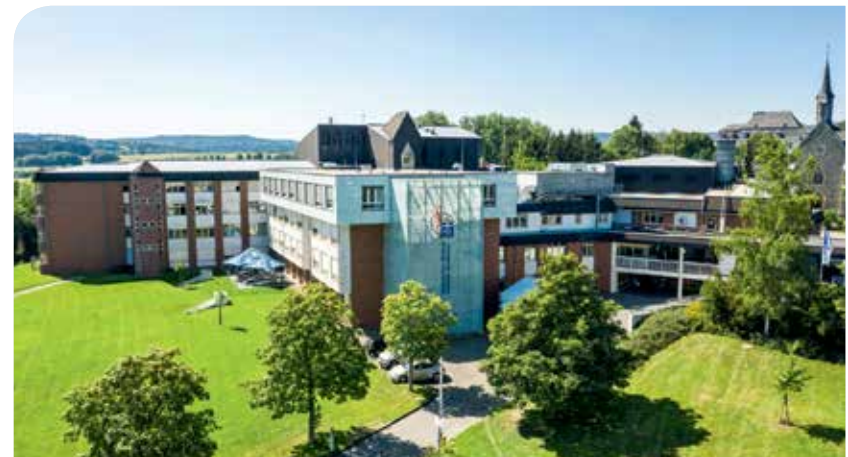
Brüderkrankenhaus Montabaur (BKM)

Kardinal-Krementsz-Straße 1-5 56073 Koblenz