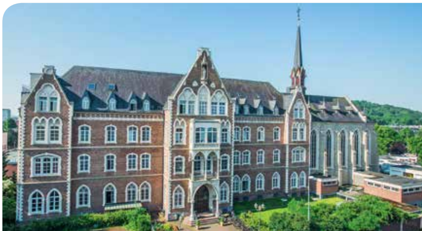
Brüderhaus Koblenz (BHK)

Kardinal-Krementsz-Straße 1-5 56073 Koblenz