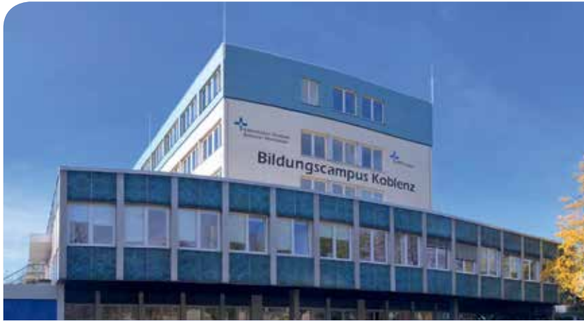
Bildungscampus Koblenz (BiK)